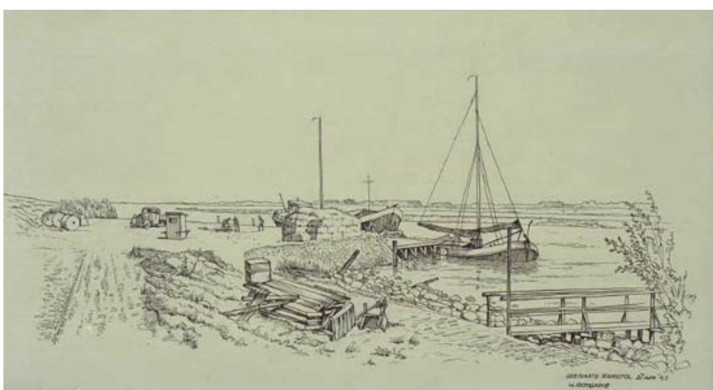
Zwaaiikom in gebruik

De zwaaikommen hebben hun functie voor vrachtschepen allang verloren; alle bieten e.d. gaat tegenwoordig met een vrachtwagen. Op veel plaatsen zijn de zwaaikommen nog wel herkenbaar in het landschap aanwezig. De vraag is hoe lang dit nog zo blijft. Geleidelijk verdwijnen de kommen omdat ze worden volgestort met de zeefgrond die vrijkomt bij het sorteren van aardappelen, bollen en uien. Uit onderzoek blijkt dat in de Noordoostpolder nog maar een paar zwaaikommen in originele staat zijn.