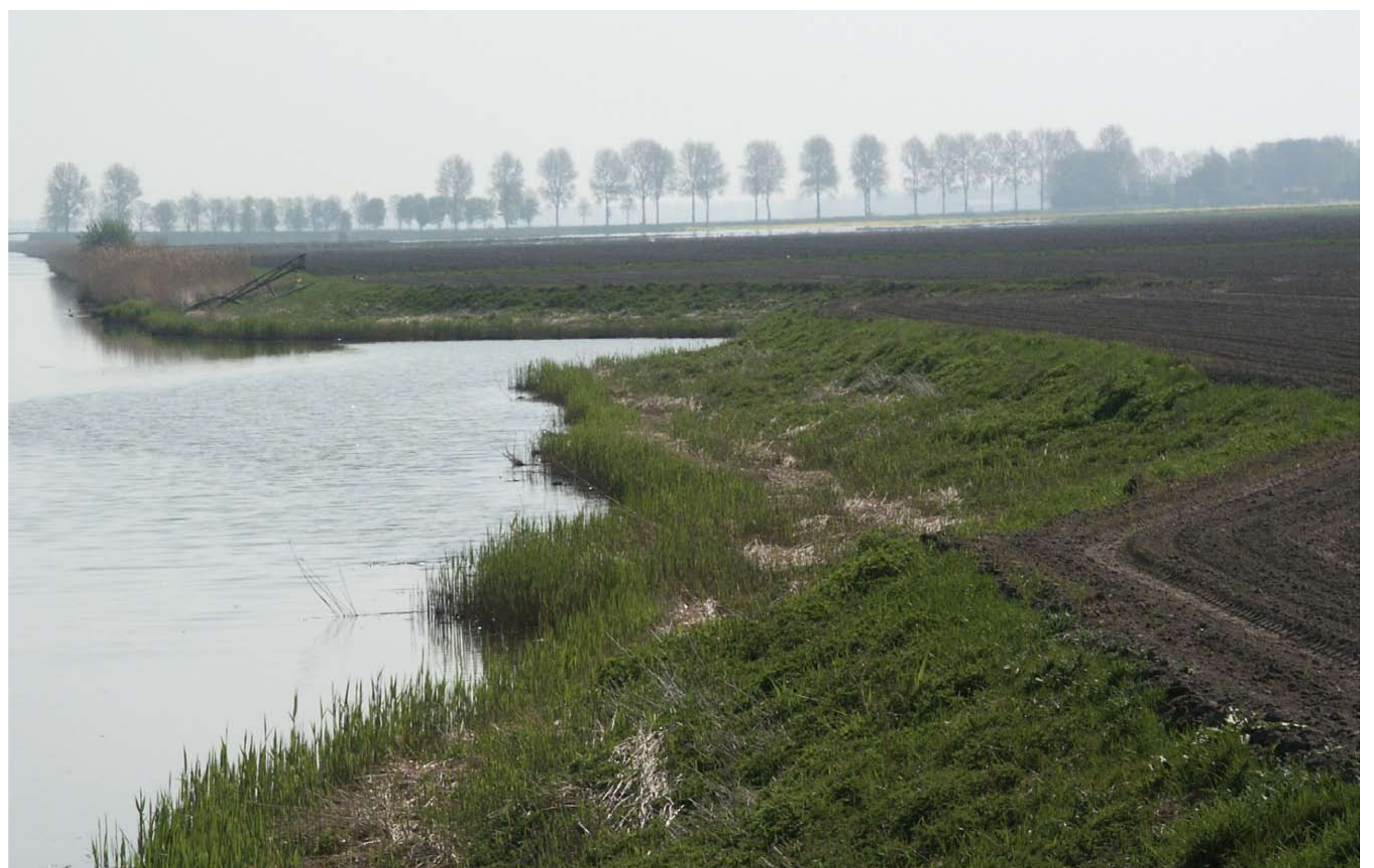
Zwaaiikom in de Creilervaart, gezien vanaf de brug op de Noordermiddenweg