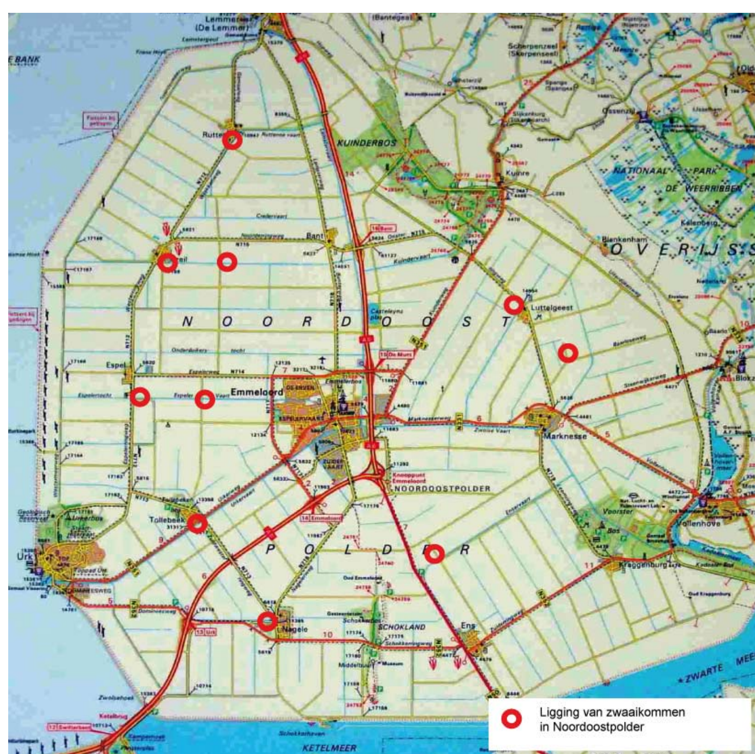
Ligging van zwaaikommen in Noordoostpolder

Naast cultuurhistorische waarde hebben de zwaaikommen een groot ecologisch belang. De inhammen vormen een onderbreking in de van beschoeiing voorziene oevers. Daardoor zijn het pareltjes van natuurlijke begroeiing in de strakke vaarten en tochten. Ze leveren een beschutte plaats voor riet- en oeverbewonende vogels als de kleine karekiet, de rietgors en in sommige gevallen de blauwborst.