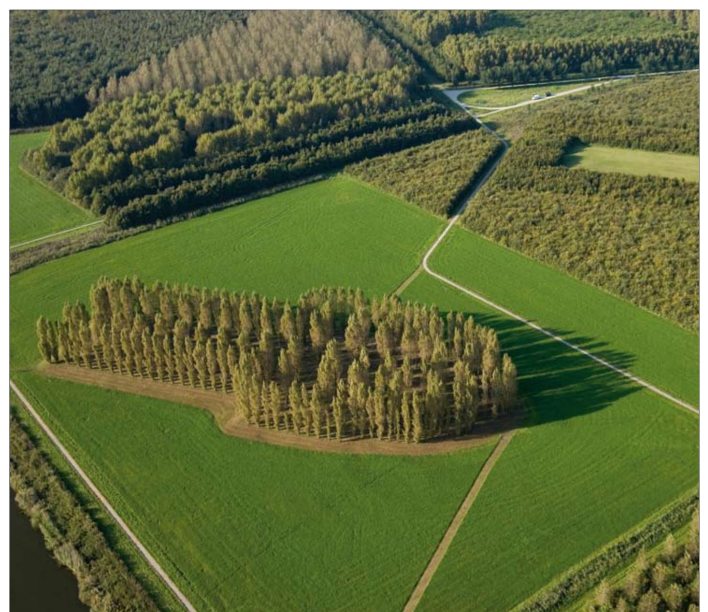
De groene kathedraal

Nadat de kerk zijn hoogste punt heeft bereikt zal het 'gebouw' weer op natuurlijke wijze afsterven en verworden tot een ruïne.