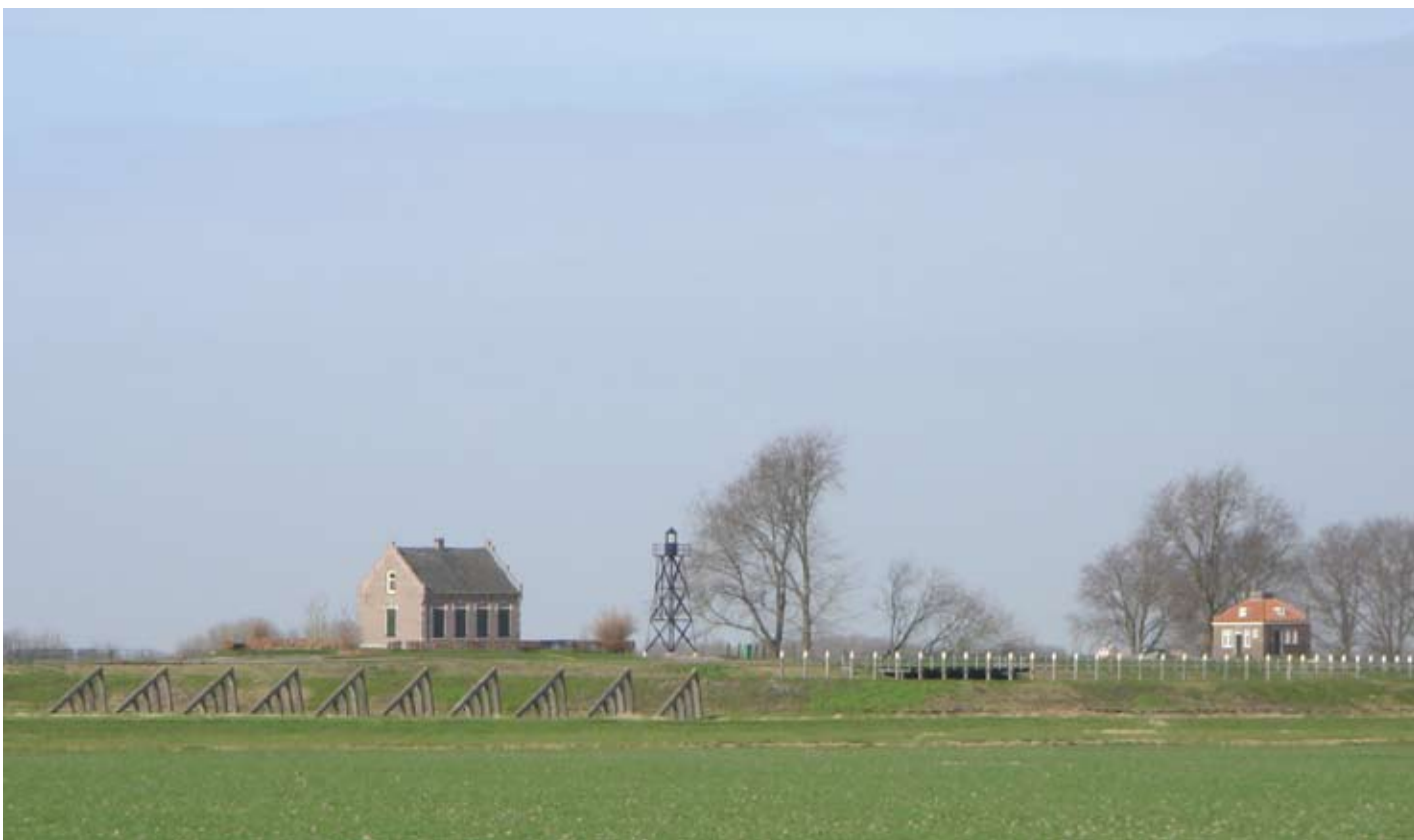
De oude haven van Schokland

Het eiland Schokland is een eiland op het droge geworden. Het ligt als een hogere rug in het polderland. Al van ver is de boombeplanting te zien als een ring rond het eiland, op de oude grens van land en water.