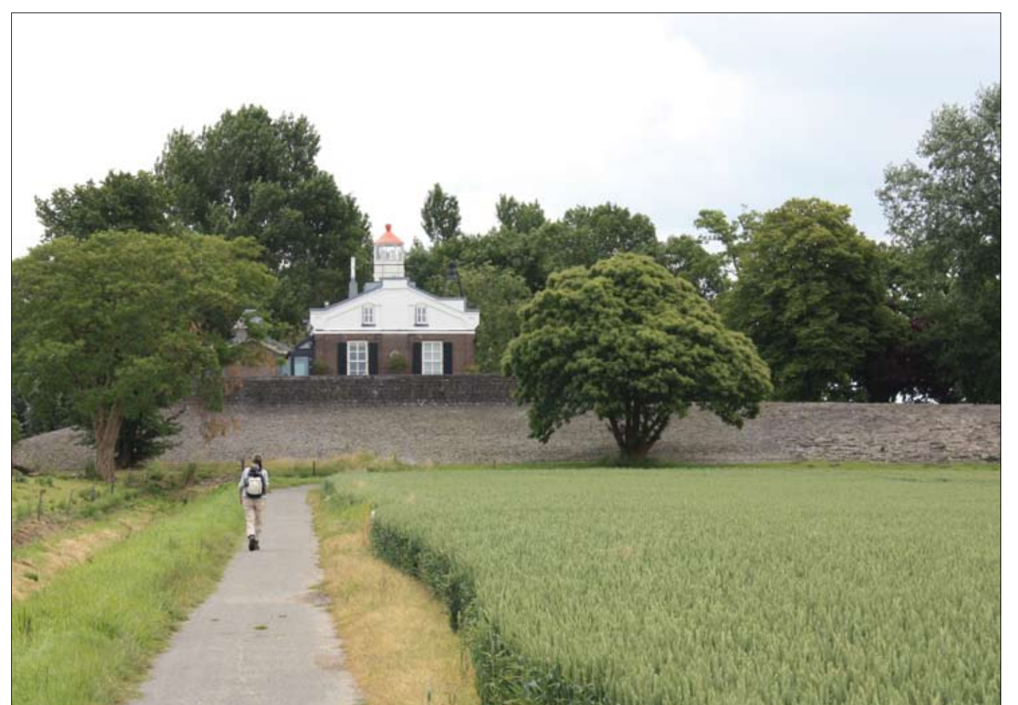
Woning lichtwachter Oud-Kraggenburg

Ook de negentiende-eeuwse vluchthaven Oud-Kraggenburg herinnert aan het verleden. De Lichtwachterswoning staat op het kunstmatig aangelegde eilandje aan het eind van twee strekdammen, die de verzanding van de monding van het Zwarte Water moesten tegengaan. Het Zwarte Water was voor de stad Zwolle eeuwenlang de belangrijkste scheepvaartverbinding met de Zuiderzee. De werkzaamheden van de lichtwachter bestonden uit het ontsteken van de lichten en op de lichtwachterswoning, maar hij moest vooral tol en liggelden innen van de schepen die bij slecht weer hun toevlucht zochten in de vluchthaven.