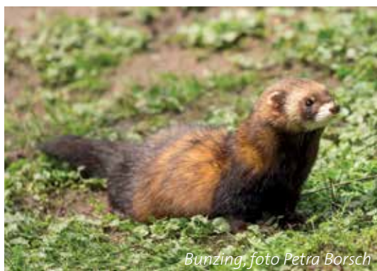
Bunzing, foto Petra Borsch

De bunzing is vooral 's nachts actief. Hij houdt van een kleinschalig landschap met veel schuilmogelijkheden en met water in de buurt. Uit onderzoek met wildcamera's in 2016 bleek dat de bunzing in één op de drie tuinen met vijver in Lelystad rondscharrelt. Mogelijk speelt concurrentie met de steenmarter in andere dorpen en steden een rol. In Lelystad is de steenmarter beperkt aanwezig, maar wel in opkomst.