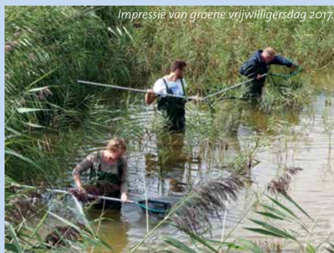
Impressie van groene vrijwilligersdag 2017.

Dit jaar willen het Flevo-landschap, Natuurmonumenten, Staatsbosbeheer en Landschapsbeheer Flevoland een dag voor Flevolandse natuurvrijwilligers organiseren. Nu lijkt dit bijna onmogelijk in coronatijd, maar er gaat vast dit jaar een moment komen dat we elkaar weer ergens fysiek kunnen ontmoeten. Deze dag heeft als doel dat vrijwilligers en verschillende natuurorganisaties elkaar kunnen ontmoeten. Het maakt toch eigenlijk niet uit voor welke organisatie je iets doet? De natuur motiveert om je er vrijwillig voor in te zetten, daardoor zijn er onderling voldoende raakvlakken. Het moet een gezellige en goed gevulde dag worden, binnen én buiten, waarop vrijwilligers en natuurorganisatie van elkaar kunnen leren. En waarop we, als het maar enigszins kan, na afloop ruimschoots met elkaar kunnen babbelen, want dat heeft iedereen enorm gemist.