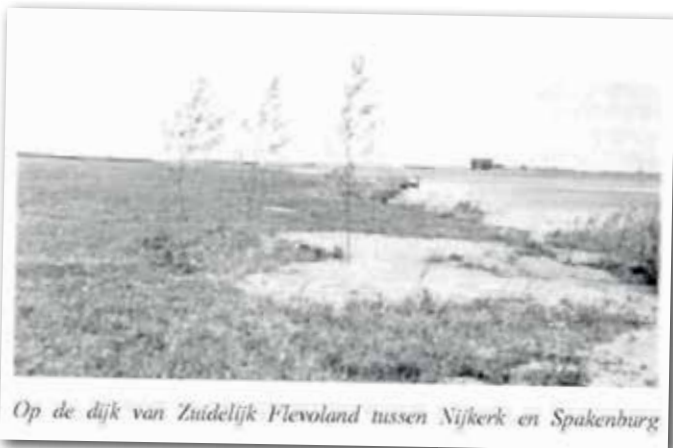
Op de dijk van Zuidelijk Flevoland tussen Nijkerk en Spakenburg

Uit: Cultuurrijp 2e jaargang nummer 9, 1 oktober 1966