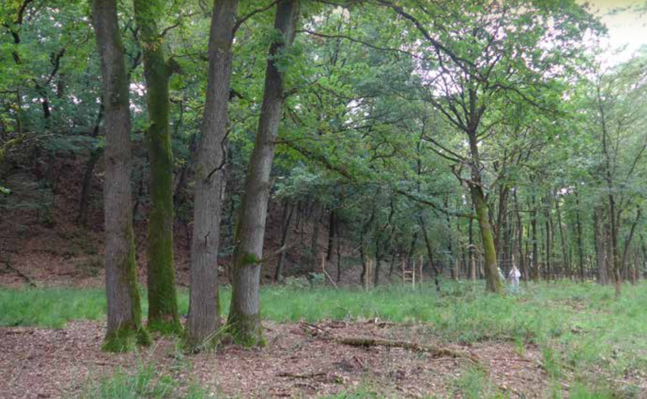
Otterlose bos aan de voet van een hoge stuifwal, met uitgegroeid hakhout van zomereik en ingerasterde wilde appel op de achtergrond. Door het stoppen van wildvraat en verwijderen van Amerikaanse vogelkers treedt weer verjonging op.