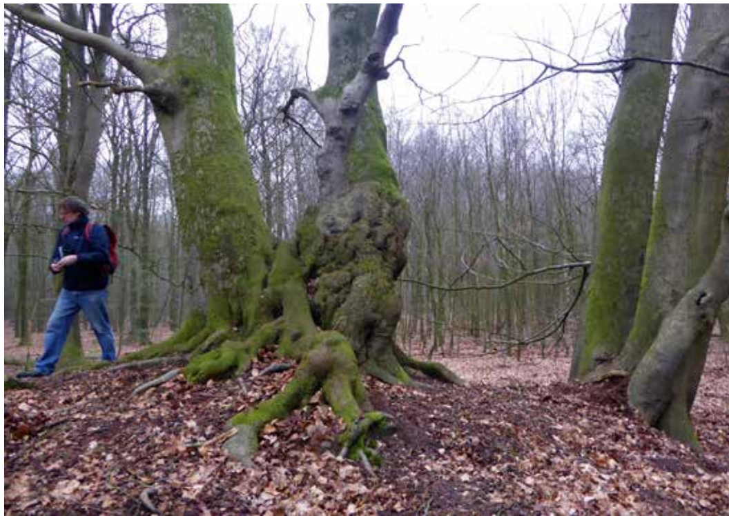
Speulder- en Sprielderbos met zeldzaam uitgegroeid hakhout van beuk: genetisch en cultuurhistorisch erfgoed.

gaan door productiepercelen om te vormen tot autochtoon bos.