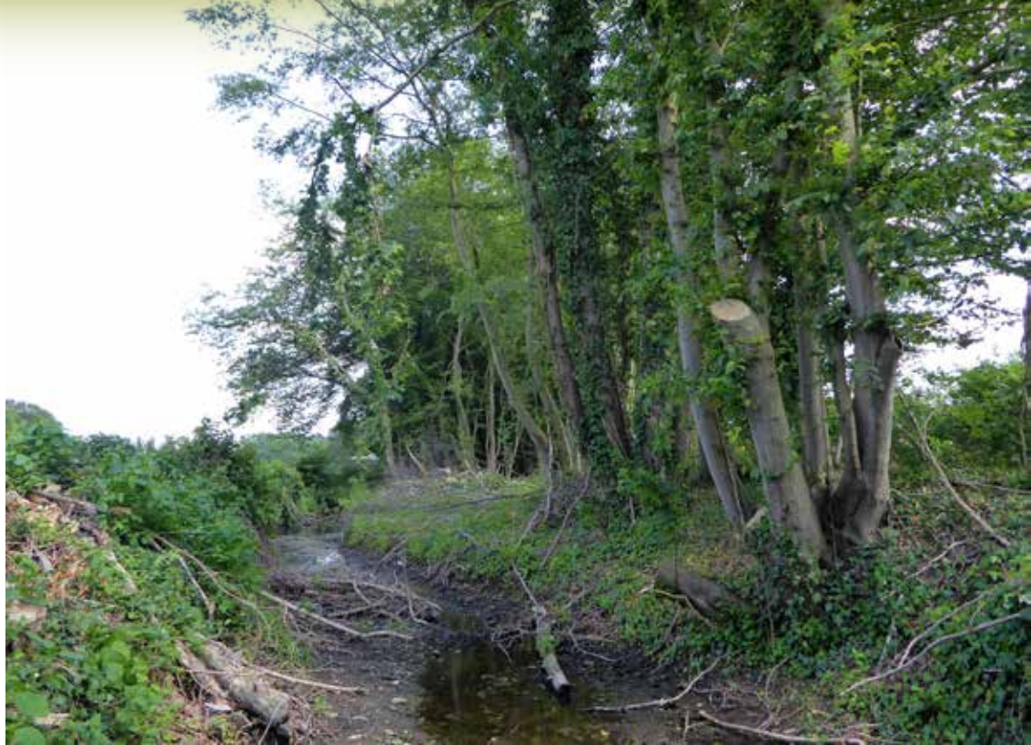
Kap van zeldzame fladderiepen langs de Willinksbeek (2019)

Voor na 1950 is veel plantgoed uit Zuidoost-Europa geïmporteerd en uitgeplant in bossen, nieuwe houtwallen en heggen. Veel van het