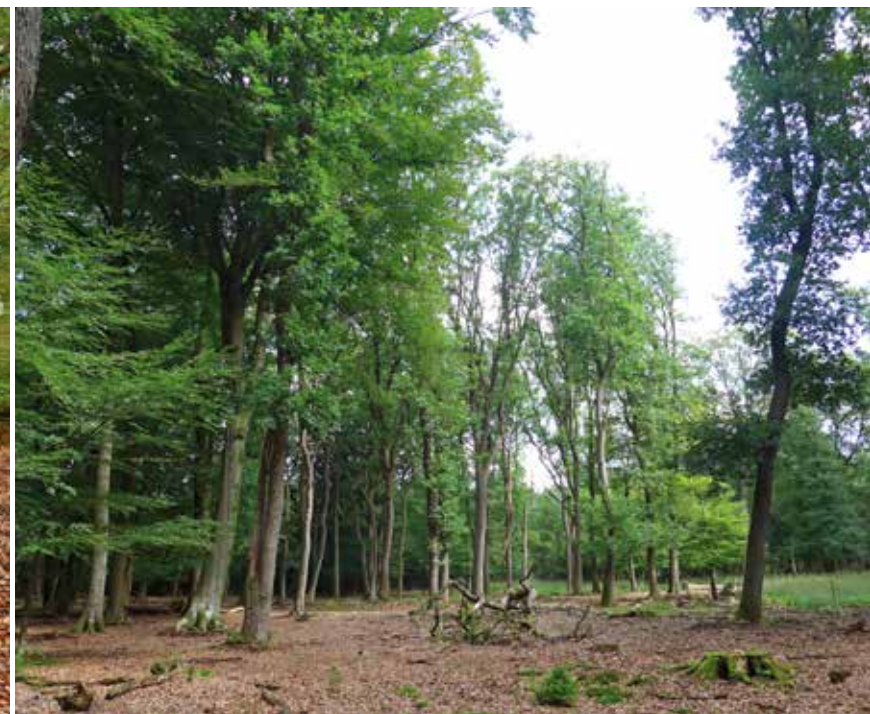
Links: geringde beuk om de lichtvragende autochtone zomer- en wintereiken te behouden (Speulderbos). Rechts: vrijgestelde wintereikengroep in het Elspebos.

herkomsten en zo nodig algemene autochtone bomen en struiken, is aan te bevelen. Bij sterke dunningen is het uitrasteren van de ontstane lichte plekken van belang om wildvraat te voorkomen en natuurlijke verjonging mogelijk te maken.